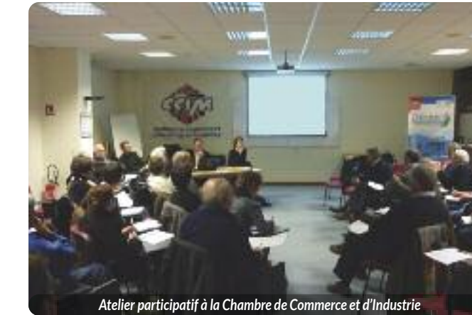
Atelier participatif à la Chambre de Commerce et d'Industrie

L'Agenda 21 sur le Net Sur son site internet, la ville propose un blog dédié à son Agenda 21. Organisé comme un centre de ressources, on peut y suivre la démarche dans ses moindres détails et consulter tous les comptes-rendus des réunions publiques. http://www.pontivy.fr/agenda21 .