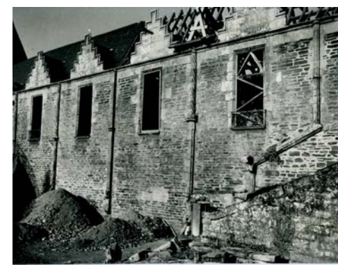
5- Restauration du château