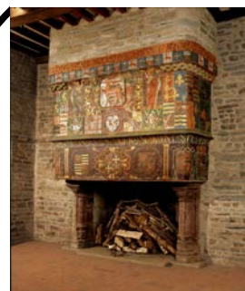
Cheminée de la salle d'honneur