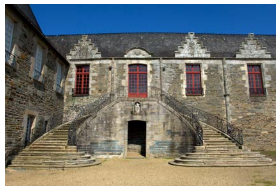
4- Escalier Louis XV