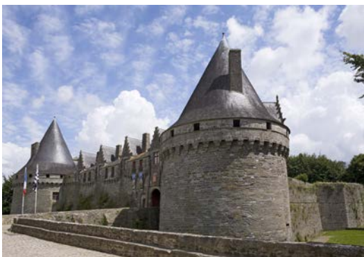
2- Construction du château fort de Pontivy