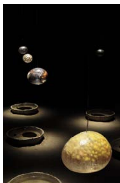
3- "Possession ovale" - Koki Watanabe