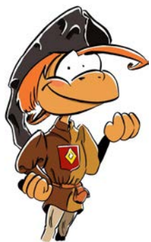
1- Jacques et toi le jour de ta visite

Replace sur la frise chaque numéro au bon emplacement !