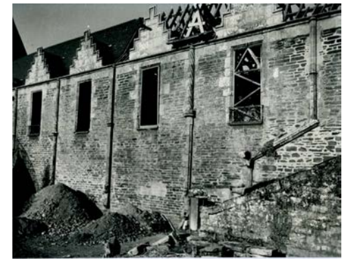
5- Restauration du château