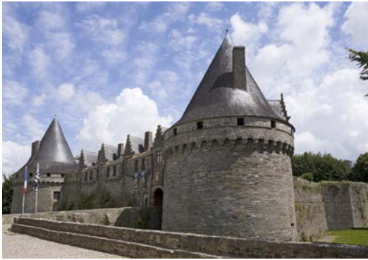
2- Construction du château fort de Pontivy