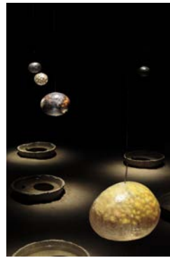
3- "Possession ovale" - Koki Watanabe