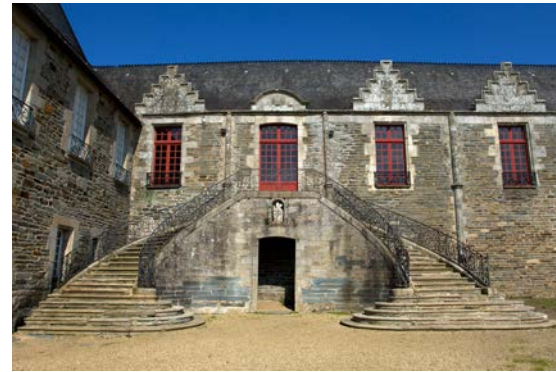
4- Escalier Louis XV