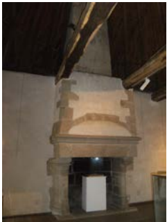
Cheminée de la tour sud-ouest

Parmi ces quatre éléments, deux ne se trouvaient pas à l'origine au château des Rohan. Lesquels ? Entoure-les.