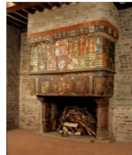
Cheminée de la salle d'honneur