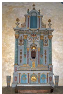
Retable de la chapelle