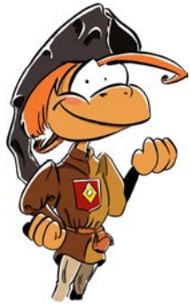
1- Jacques et toi le jour de ta visite

Replace sur la frise chaque numéro au bon emplacement !