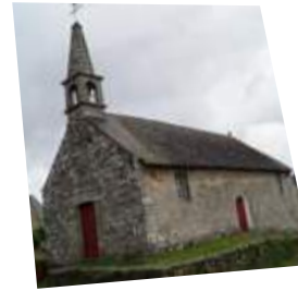
Notre-Dame de la Houssaye