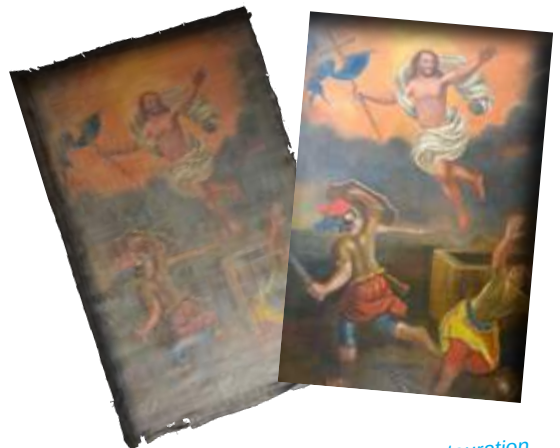
Élément du retable avant et après restauration.

Renseignements : service patrimoine, 02.97.25.00.33.