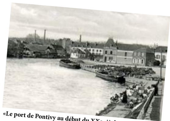
«Le port de Pontivy au début du XXe siècle»