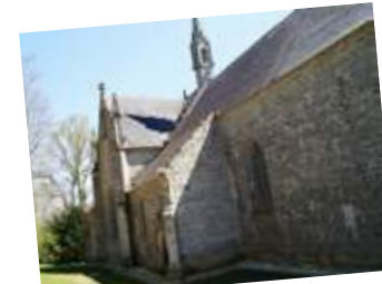
Saint-Mériadec de Stival

Pratique : chapelles Sainte-Tréphine et Notre-Dame de la Houssaye, église Saint-Mériadec de Stival (circuit de L'art dans les chapelles), ouverture samedi et dimanche de 14h à 19h. Visite libre ou commentée sur demande. Dimanche 20 septembre, 14h-18h : circuit commenté par la médiatrice de L'art dans les chapelles avec passage à Sainte-Tréphine. Départ à 14h de l'office du tourisme. Renseignements : L'art dans les chapelles, 02.97.51.97.21 ou www.artchapelles.com . Notre-Dame de Joie : ouverture samedi et dimanche, de 8h à 19h. Visites libres sauf pendant les célébrations (samedi 18h-19h, dimanche 11h-12h). Renseignements : presbytère de Pontivy, 02.97.25.02.53.